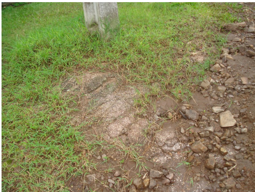
Basalto da área

A - Descrição e avaliação hidrogeológica local especificando as características físicas dos aquíferos e dos corpos hídricos superficiais no trecho em que se inserem na área do empreendimento (vazão, larguras média e máxima e cota máxima de inundação).